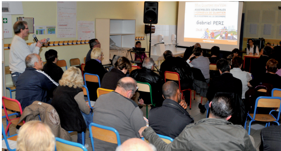
Les habitants interpellent les délégués pour soulever des thèmes à débattre