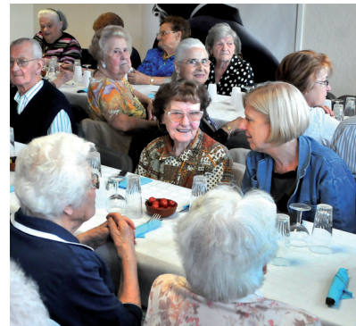
Repas à la résidence Henri-Raynaud

Résidence pour personnes âgées Henri-Raynaud, 4 rue Prosper-Alfaric