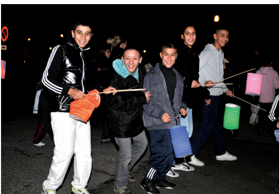
Défilé aux lampions 2010