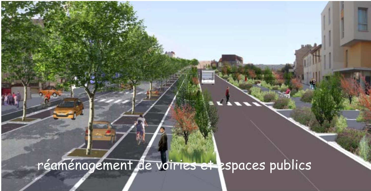
réaménagement de voiries et espaces publics