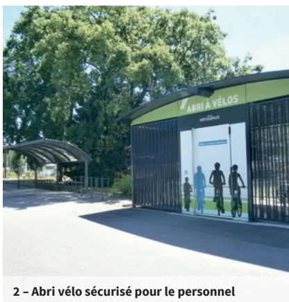
2 - Abri vélo sécurisé pour le personnel