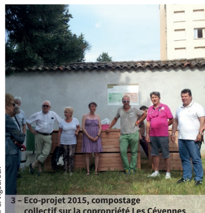
3 - Eco-projet 2015, compostage collectif sur la copropriété Les Cévennes